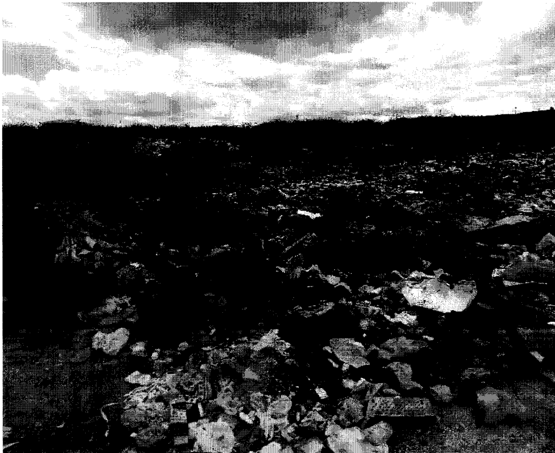
Слика 1: Дива депонија во Скопскиот регион